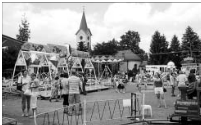
Také letos se neděli před svátkem sv. Václava slavilo v Černilově posvícení.