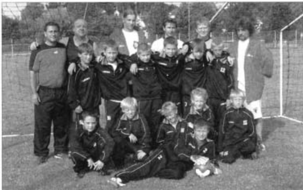
Mladí fotbalisté Černilova si úspěšně vedli na turnaji v Rakousku, ve kterém nepoznali hořkost porážky.

Černilov - Mladí fotbalisté FK Černilov strávili víkend na výměnném pobytu v rakouském Ottensheimu, který pro ně připravil partnerský fotbalový klub LASK Linz. V sobotu se černilovské naděje zúčastnily turnaje se třemi celky rakouské žákovské soutěže, dva z Linze a místní Ottensheim. Východočeši ho zvládli na výbornou, ani jednou neinkasovali a každý soupeř si odnesl minimálně tři góly. První místo tak bylo pro chlapce velkým zážitkem. Všechna utkání zdobily krásné fotbalové momenty i počasí a při odpoledním grilování už nebyly mezi dětmi žádné jazykové bariéry. Všechny další aktivity i cesta domů proběhly hladce, a tak to byl jeden z nejkrásnějších víkendů s černilovským fotbalem. (8)