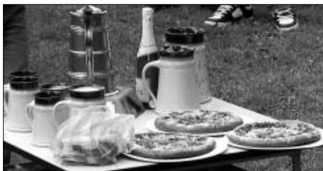
Ceny určené vítězům fotbalového turnaje

Nechybí veliké posvícenské koláče. Místní slečny si zvolí toho nejhezčího hráče. Tím doplní kategorie nejlepší hráč, střelec a brankář. Na podstavci tupláku přibude vyryto další jméno vítězů. Tím se po tříleté pauze stalo letos mužstvo Lejšovka A. Dále se umístili Staří Páni HK, Frantin mix, Kubrti z Černilova a Lejšovka B. Lejšovské týmy byly vydatně posíleny hráči z Libřice. Vítězové i poražení, domácí i přespolní se nakonec sešli u občerstvení.