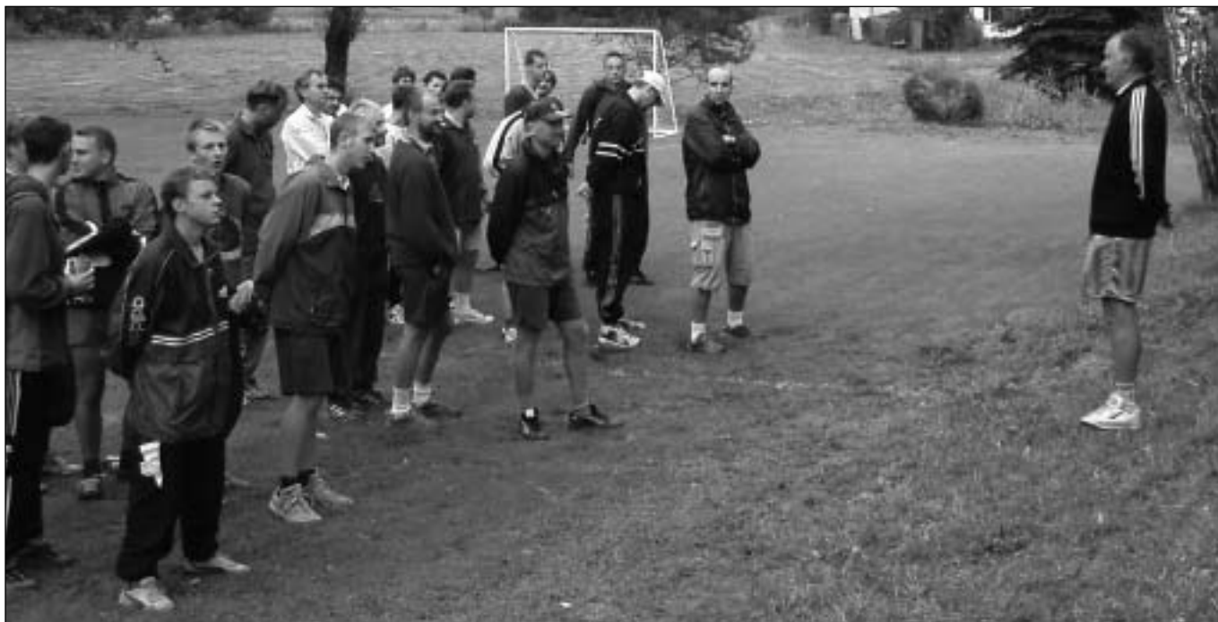
Fotbal v Lejšovce - nástup družstev.