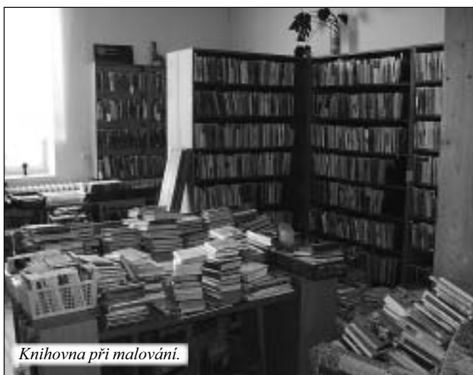
Knihovna při malování.