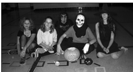
Osmáci ve škole dobrovolně prožili noc! (samozřejmě s bdělým dozorem třídních učitelek).