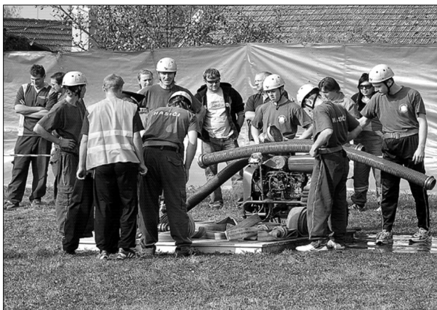
Pečlivá příprava družstva na základně je základ úspěchu.