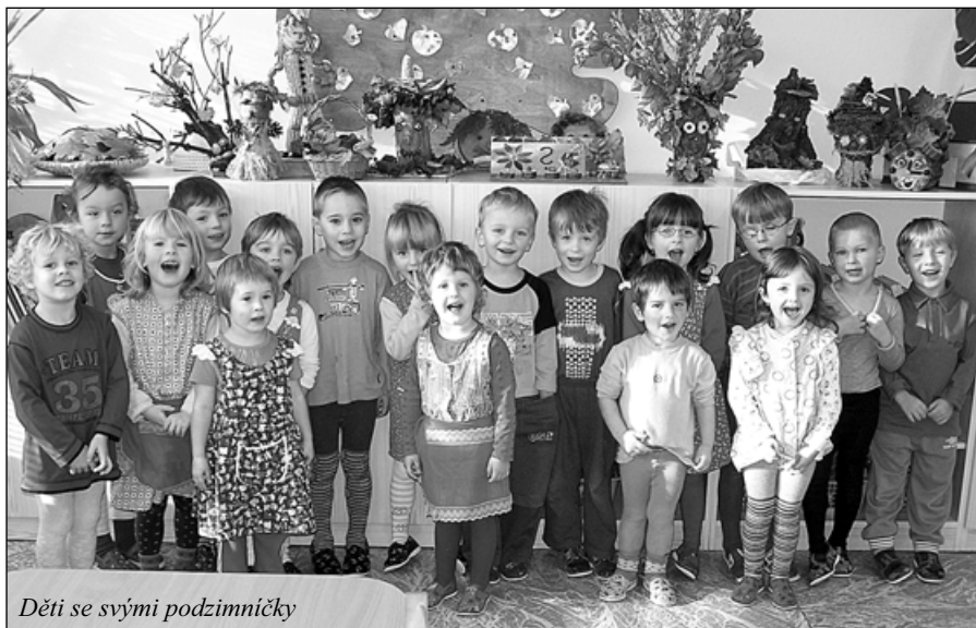
Děti se svými podzimníčky