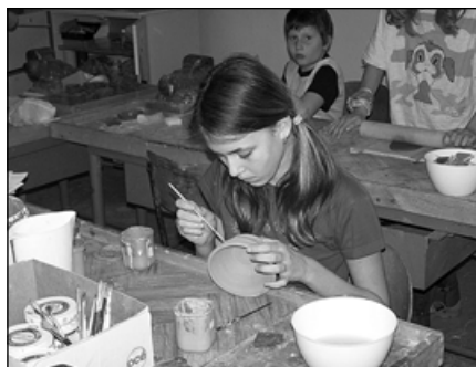
Z keramické dílny (pod vedením pí uč. Blatníkové).