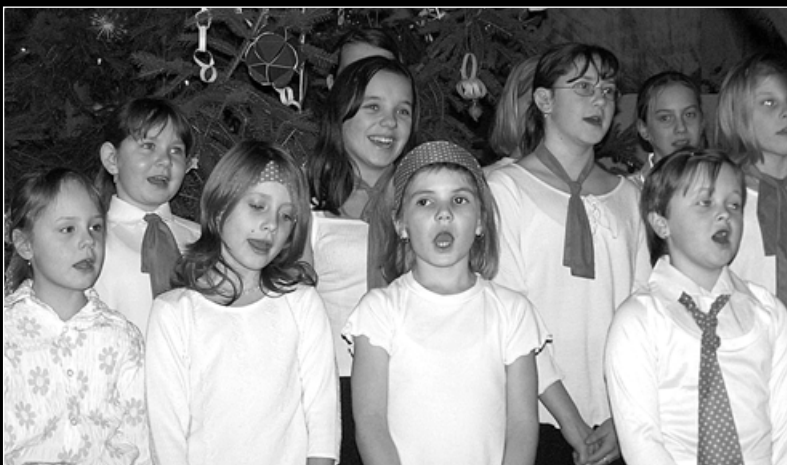
Z loňského vánočního koncertu základní školy.

Uslyšíte samozřejmě i vánoční koledy! Kromě koncertu se koná také prodejní výstava prací žáků černilovské školy, která bude pro Vás otevřena v 16:00 hodin.