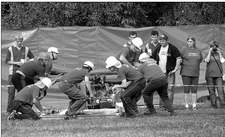
Družstvo po startu v akci.