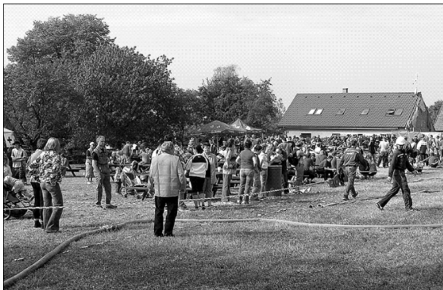
Diváků i soutěžících přišlo díky pěknému počasí hodně.