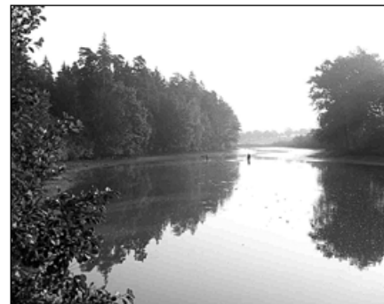
Rybník Na Kamenské.