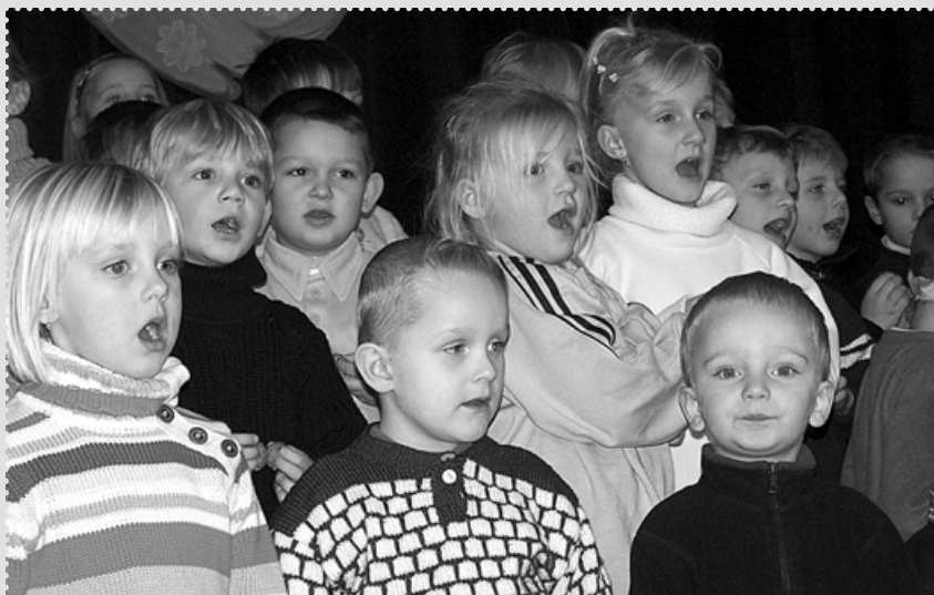
Z loňského vánočního koncertu mateřské školy.