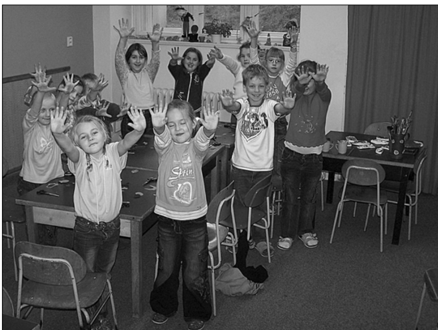
„Šikulové“ ze školní družiny (pod vedením pí uč. Pešavové vyrábějí obrázky ze sádry).