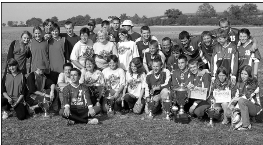
Tři celkově nejúspěšnější družstva Východočeské hasičské ligy v kategorii muži a ženy.