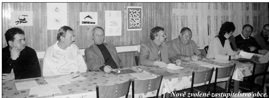
Nově zvolené zastupitelstvo obce.