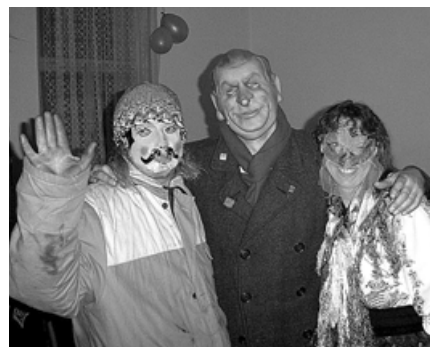
Z loňského maskarního plesu.

At přijdete v masce nebo v „civilu“ určitě se budete dobře bavit.