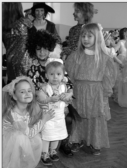
Z loňského dětského karnevalu.

Zveme všechny lidičky děti, maminky, tatínky, dědečky a babičky