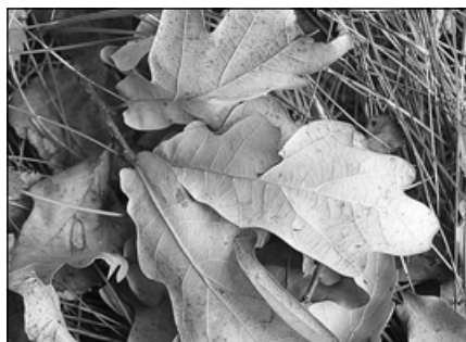
Soutěž „Podzim na digitální fotografii“ (1. místo)