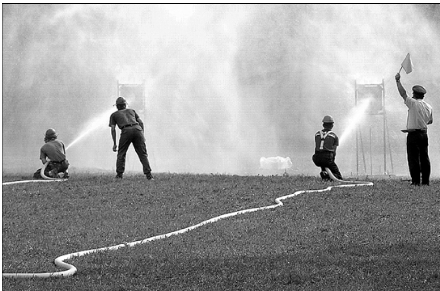
Kvalitní proud vody a nástřik terčů rozhoduje o celkovém výsledku.