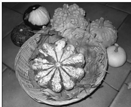
Soutěž „Podzim na digitální fotografii“ (1. místo)