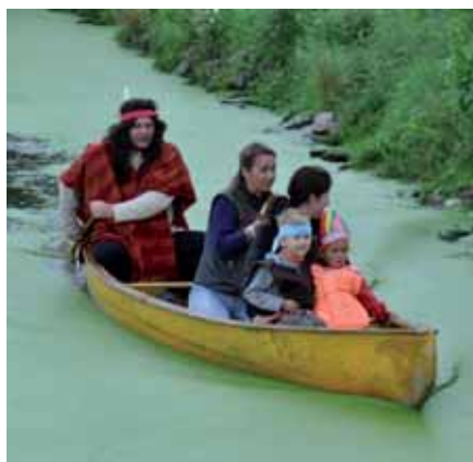
Rozloučení s prázdninami