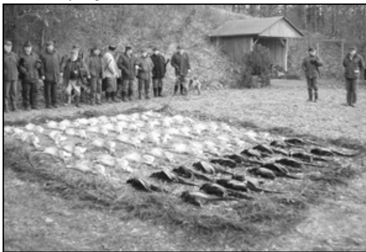
poslední výřad MS Habřina 2009

Librantice v roce minulém bych chtěl popřát našim členům a všem myslivcům Mikroregionu Černilovsko v letošním roce mnoho krásných loveckých zážitků a hodně sil při práci při zvelebování naší, české myslivosti.