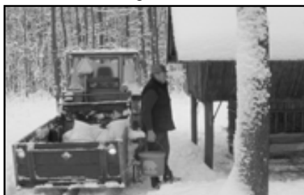
rozvoz krmiv do krmelců

Myslivecké sdružení „HABŘINA“ Librantice hospodaří v honitbě, jejímž držitelem je Honební společenstvo Librantice – Nepasice. Výměra honitby činí 1347 ha. Myslivecké sdružení má v současné době 24 členů a jednoho adepta. Činnost sdružení řídí 5-ti členný výbor. Členská schůze se koná pravidelně vždy začátkem měsíce, kde se projedná a připraví činnost na období do příští schůze. Veškerá