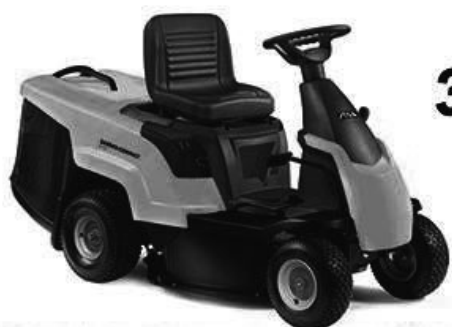
Garden Compact E HST