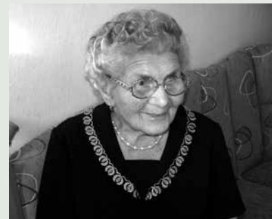
foto z oslavy 100. narozenin