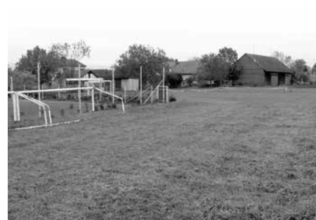
Víceúčelová sportovní hala, 1. etapa – šatny a občerstvovna