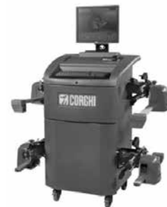
seřizování geometrií náprav