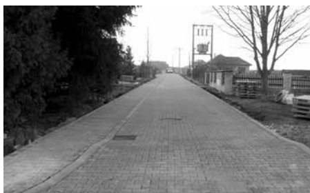
Víceúčelová sportovní hala, 0. etapa – komunikace a sítě