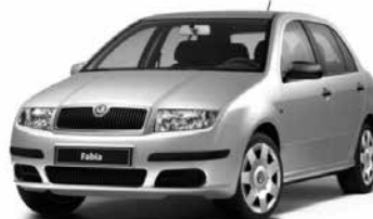
zapůjčení náhradního vozidla