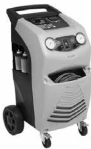
servis a čištění klimatizací