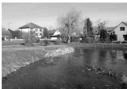
Požární ekologická nádrž na dolejší konci