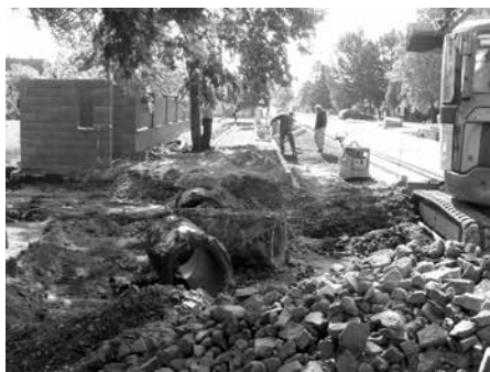
Autobusová zastávka u školy