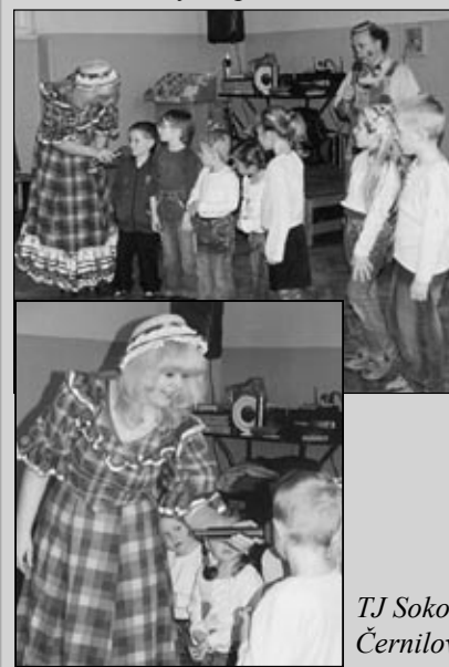
TJ Sokol Černilov