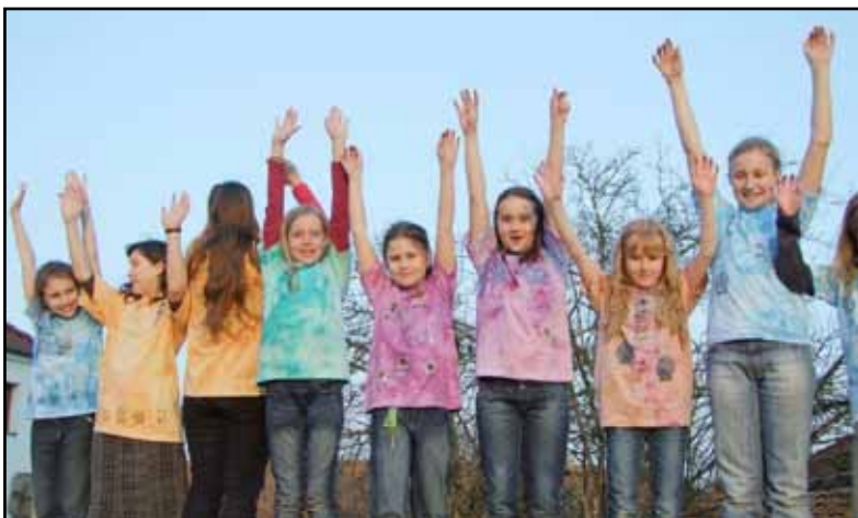
Tvořivý kroužek v KSD (vlevo)