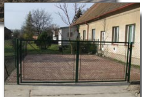
Sběrná místa ve Skaličce a v Libranticích