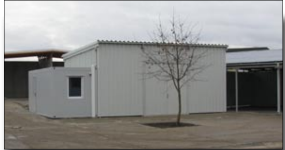
Sběrné místo v Černilově

podstatnou vadu, je totiž dlouhodobě ekonomicky neudržitelný. Druhý systém financování odpadového hospodářství je ten, že obec sama vybírá od všech svých občanů poplatky a sama hradí svozové firmě veškeré náklady. Tento poplatek je stanoven tak, aby pokryl náklady na všechny odpady. Každá obec, která využívá tento systém poplatků „na hlavu“, si stanoví vyhláškou s ohledem na skutečné výdaje výši poplatku i systém slev. Zatím nemáme připraven konkrétní návrh, tuto informaci berte jako podnět k diskusi.