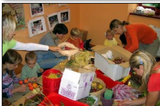
Vyrábíme z dýní