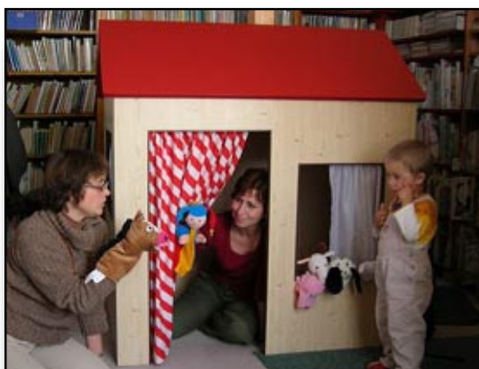
Na návštěvě v černilovské knihovně